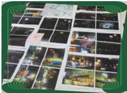
(黄組) 夜の堺東は、街灯の背が高く、暗い。ナンテン電車の活用が必要。観光に対して、御陵案内の看板不足。PR方法を検討。リビーターの確保など、堺の観光政策について考えたい。

各班のまち歩きや長浜市の見学会について、気付いたことや、参考になった点などを話し合い、私たちの町との違いや参考になることを出し合いました。他の町と比較したり、改めて堺の町を歩くと、課題・問題点が多く抽出され、今後追求めていきたいとの意見もありました。また、仲間づくりを大切に、今後も交流を深めていきたいとの意見もありました。