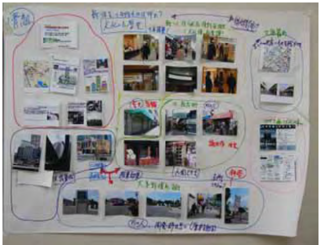
(青組) 三現主義(現場・現物・現実)に沿って、北野田界隈を再確認・再発見した。新旧の連携・融合、相乗効果を検討するため、その町の歴史を知ることであり、今後も知り合った仲間を大切に、続けていく。